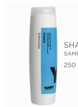
SHAMPOO/ SAMPON 250 ml