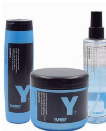
ULTRAFÉNYŰ SAMPON GYÉMÁNTPORRAL 250 ml