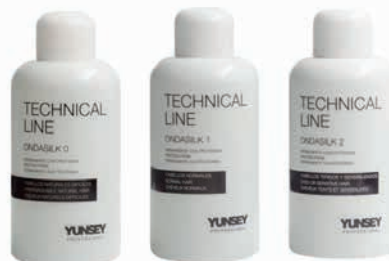
ONDASILK DAUERVIZ 0,1,2 ERŐSSÉG 500 ml