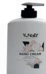
YUNSEY KÉZKÉM 300 ml