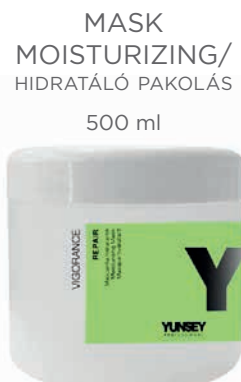
MASK MOISTURIZING/ HIDRATÁLÓ PAKOLÁS