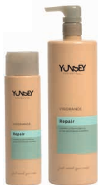
SHAMPOO ULTRA NUTRITIVE/ ULTRA TÁPLÁLÓ SAMPON