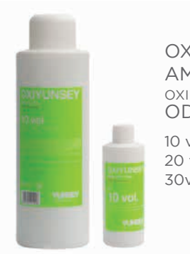
OXYUNSEY AMMÓNIAMENTES OXIDÁLÓ KRÉM EMULZIÓ ODS TECHNOLÓGIA 10 vol (3%) 120 ml/1000 ml, 20 vol (6%) 120 ml/1000 ml, 30vol (9%) 120 ml/1000 ml