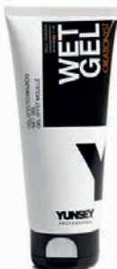
WET GEL/ VIZES HATÁSÚ GÉL 200 ml