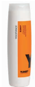
SHAMPOO/ SAMPON 250 ml