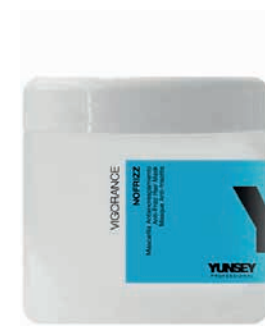
MASK 500 ml