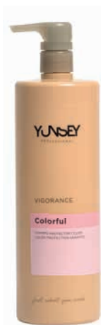
SHAMPOO/ HAJSZÍNVÉDŐ SAMPON 300 ml, 1000 ml