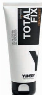
TOTAL FIX gél EXTRAERŐS TARTÁS 200 ml