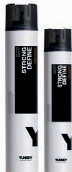
STRONG/ ERŐS HAJLAKK 500 ml, 750 ml