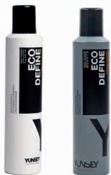
ECO DEFINE 1. EXTRAERŐS 2. ULTRAERŐS PUMPÁS HAJLAKK 300 ml