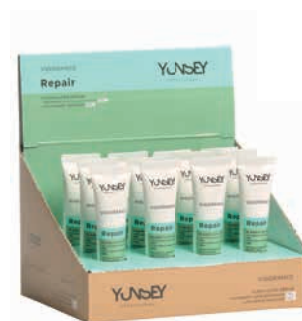
ULTRA REPAIR FLASH/ AZONNALI HATÁSÚ AMPULLÁS ULTRA TÁPLÁLÓ