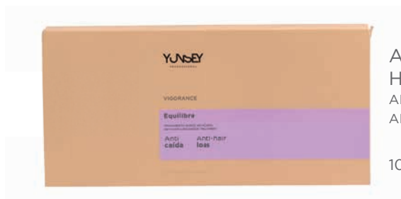
AMPULLÁS KEZELÉS HAJHULLÁSRA ANTI-HAIRLOSS AMPOULLES