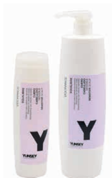
ÉRZÉKENY FEJBŐR SAMPON (KAMILLÁVAL ÉS SZÓJAPROTEINNEL) SENSITIVE SHAMPOO ÉRZÉKENY FEJBŐRRE