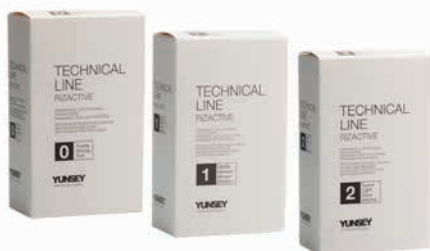
RIZACTIVE DAUERVIZ ÉS FIXÁLÓ SZETT 0,1,2 ERŐSSÉG 80+80 ml