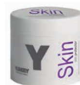
SKIN PROTECTOR BŐRVÉDŐ WAX VÉDI A BŐRT AZ AGRESSZÍV KÉMIAI FOLYAMATOKTÓL.