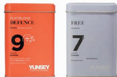
DEFENCE: EXTRA GYORS VILÁGOSÍTÁS. PEKTINNEL A HAJ VÉDELMÉÉRT. 9 ÁRNYALATIG VILÁGOSÍT.

500 g, 30 g (utántöltő: 1x500 g, 4x500 g)