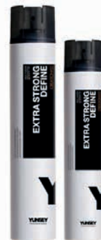
EXTRA STRONG/ EXTRAERŐS HAJLAKK 75 ml, 500 ml, 750 ml