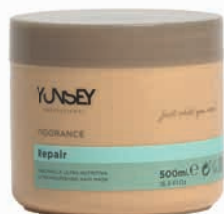
ULTRANUTRITIVE MASK/ ULTRA TÁPLÁLÓ PAKOLÁS