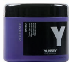
MASK/PAKOLÁS 500 ml