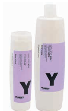
ZSÍROS HAJRA SAMPON (EUKALIPTUSZ, FEHÉR CSALÁN, KAKUKKFŰ) OILY SHAMPOO