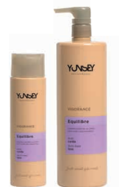
HAJHULLÁS ELLEN SAMPON ANTI-HAIRLOSS SHAMPOO 300 ml, 1000 ml