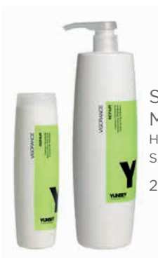
SHAMPOO MOISTURIZING/ HIDRATÁLÓ SAMPON 250 ml, 1000 ml

TÁPLÁLJÁK ÉS ÚJJÁÉPÍTIK A HAJROSTOT. HIDRATÁLÓK HYALURONSÁVVAL.