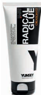
RADICAL GLUE gél ULTRAERŐS TARTÁS 200 ml