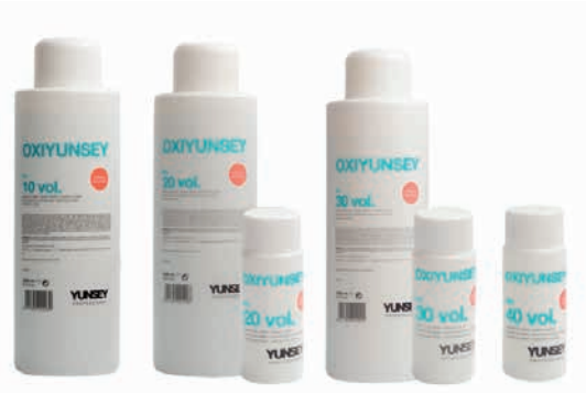
OXYUNSEY OXIDÁLÓ KRÉM EMULZIÓ 10 vol(3%) 120 ml/1000 ml, 20 vol(6%) 60 ml/1000 ml, 30vol (9%) 60 ml/1000 ml, 40 vol(12%) 60 ml/1000 ml