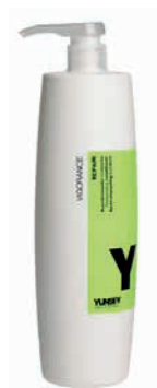
MOISTURIZING CONDITIONER/ HIDRATÁLÓ BALZSAM 1000 ml