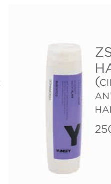
ZSÍROS KOPÁS HAJRA SAMPON (CINK ÉS PYRITONE) ANTI-DANDRUFF FOR OILY HAIR SHAMPOO