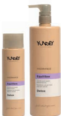
SZÁRAZ VÉG, ZSÍROS TŐ SAMPON DRY ENDS, OILY ROOTS SHAMPOO