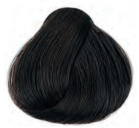
4 Középbarna Stredná hnedá Medium brown Castaño medio