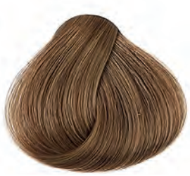
8 Világosszőke Svetlá blond Rubio claro Light blonde