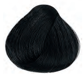
2 Fekete Čierna Black Moreno