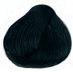
1 Kékesfekete Modročierna Blue black Negro azul