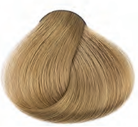
9 Nagyon világosszőke Extra svetlá blond Extra-light blonde Rubio extraclaro