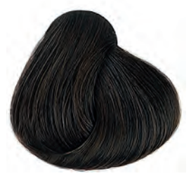
5 Világosbarna Svetlá hnedá Light brown Castaño claro