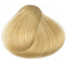
10 Platinaszőke Platinová blond Platinum blonde Rubio platino