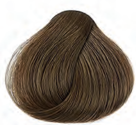
7 Közép szőke Stredná blond Medium blonde Rubio medio