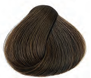
6 Sötétszőke Tmavá blond Dark blonde Rubio oscuro