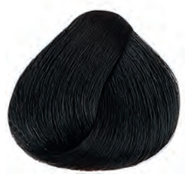
3 Sötétbarna Tmavá hnedá Dark brown Castaño oscuro